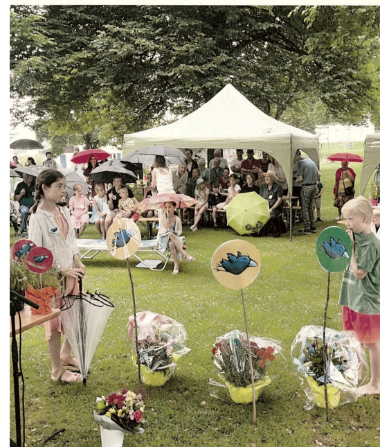
Ein Höhepunkt im Sommer: Das Tauffest in der Badi Bassersdorf.