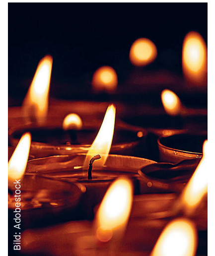
Jeden Mittwoch um 19 Uhr, vom 4. März bis 1. April