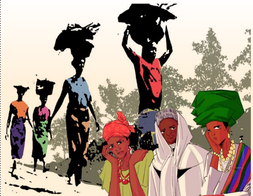
Artwork-2026-Rest-for-the-Weary-by-Gift-Amara-Ottah, WGT Schweiz