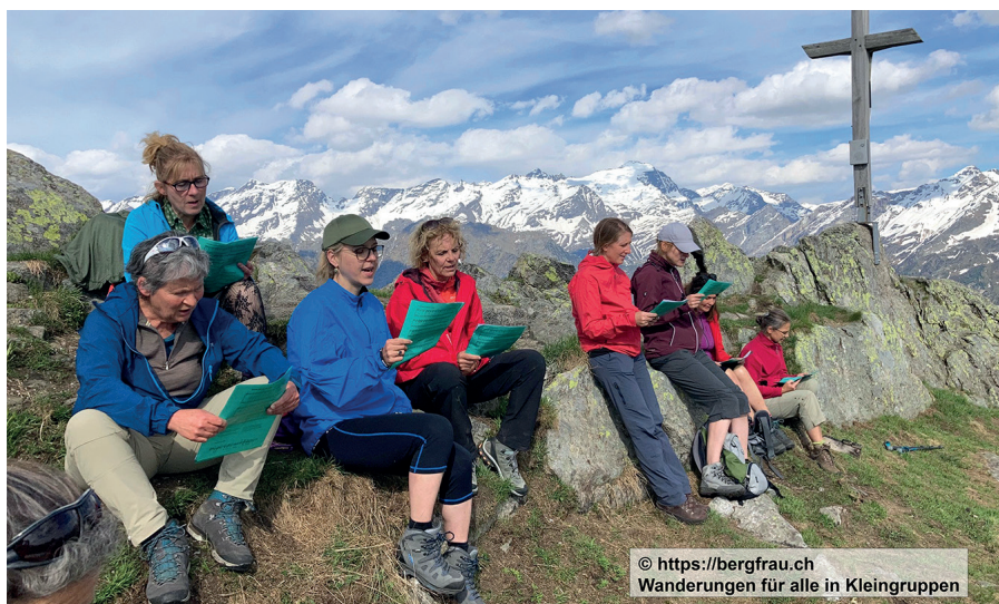
Wanderungen für alle in Kleingruppen