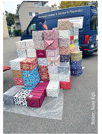
Bilder: Susy Egli