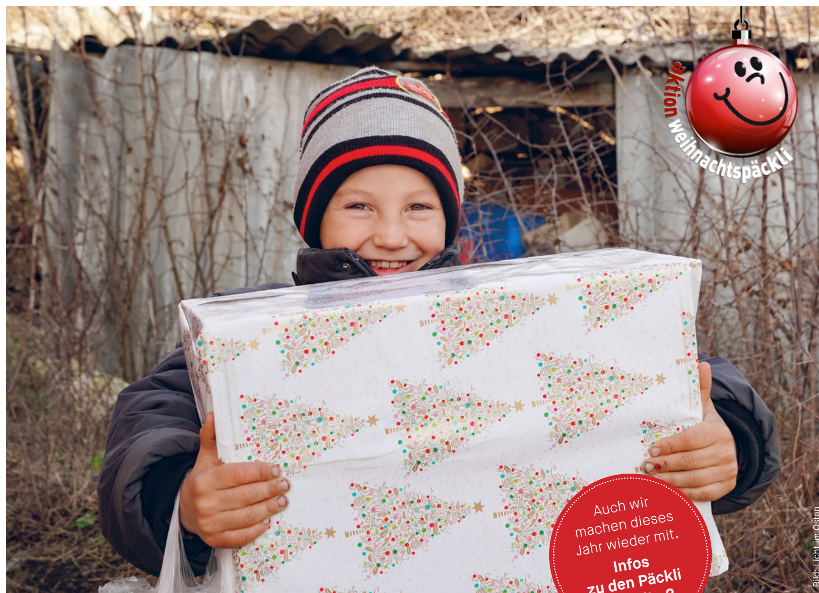
Liebevoll verpackte Weihnachtspäckli aus der Schweiz bringen Freude und Hoffnung nach Osteuropa!

Letztes Jahr wurden 117800 Päckli schweizweit gesammelt, wieviele werden es dieses Jahr sein?