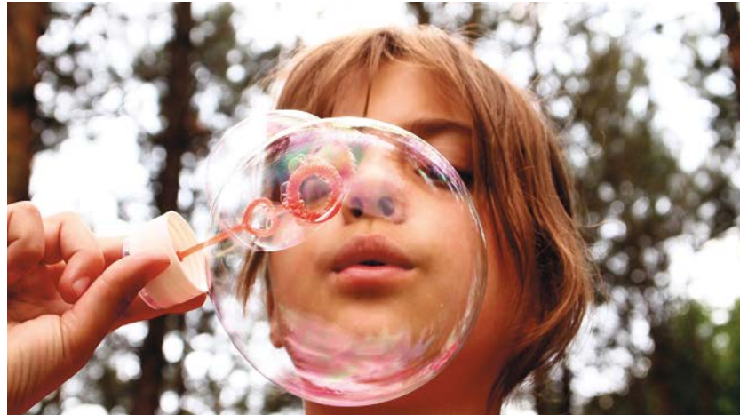
Sommerferienplausch daheim! Es hat noch freie Plätze!

Montag, 5. bis Freitag, 9. August Zentrumsbau Nürensdorf